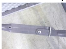
Loquet pour le verrouillage des pieds

Retournez la table, puis vérifiez que tous les loquets de verrouillage sont bien enclenchés. Assurez-vous que la table est stable avant toute utilisation.